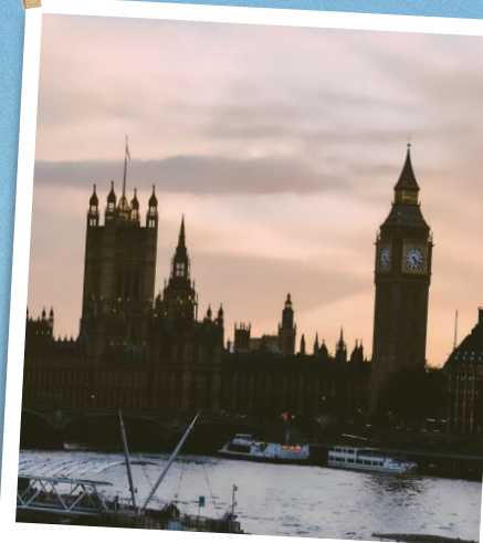
知識としての景色が 現実のひとこまとして動き出す

「海外体験」は、海外の協定校への留学や私費留学、インターンシップやボランティアなどの海外プログラムに参加し、帰国後に所定の申請を行うことで認定されます。