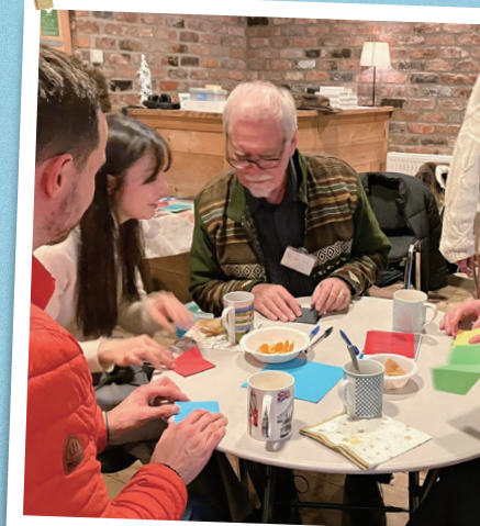
異文化理解の楽しさに 気付くことができた留学