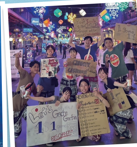
カンボジアでの ビジネスインターンシップ