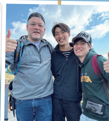
英語で考え、発信する力が 養われた短期留学