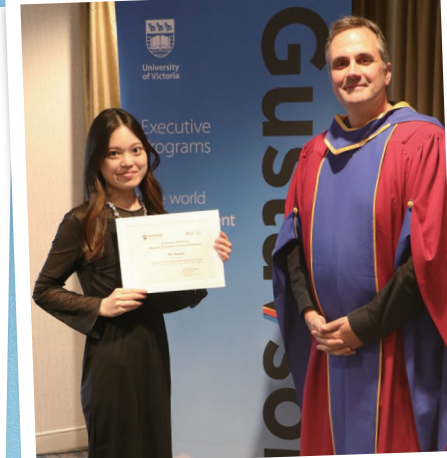
世界に通用するスキルや マインドを養った短期留学