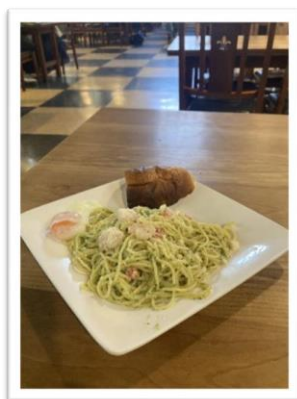
本日のプレミアムパスタ 「ジェノベーゼ フォカッチャ付」 (温玉別売)