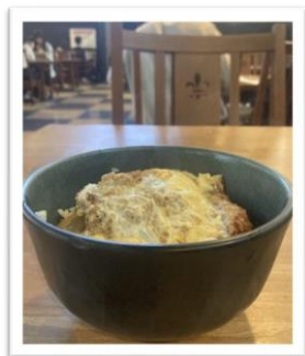
カツ丼 490円 (味噌汁別売)